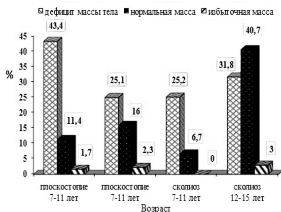
Рис. 2. Антропометрическая характеристика школьников 7–15 лет с ДЗКМС г. Арзамаса

Сочетание неокрепшего костного аппарата, соединенного растяжимыми связками, и слабых мышц, сопровождающих дефицит массы тела, приводит к кумулятивному эффекту. Именно это влечет за собой опущение сводов стопы с перемещением центра тяжести и потерей стопы всех ее функций, с одной стороны, и невозможность мышечного корсета удерживать позвоночник, с другой. Кроме того, мы полагаем, что возникшее несоответствие между ростом костной и мышечной масс в пубертатном периоде приводит к диспропорции между темпами роста,